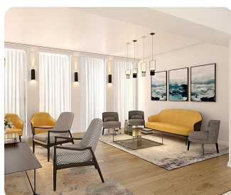
לאונג' הנהלה (הדמיה)