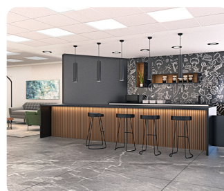
בר דיירים (הדמיה)