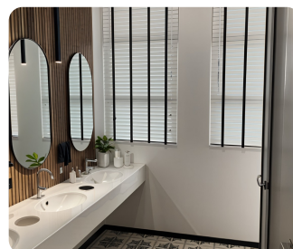
שירותים נגשים (ביצוע)