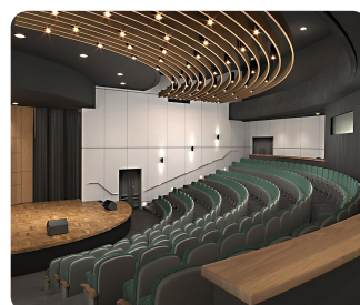
היכל תרבות (הדמיה)