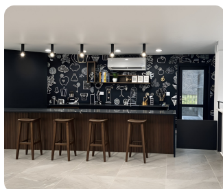
מטבח מעוצב (ביצוע)