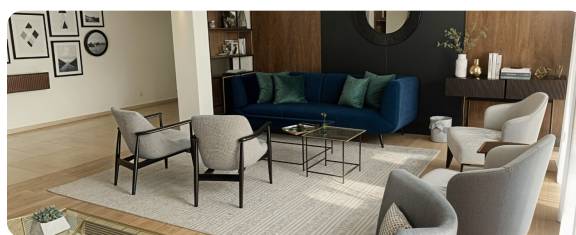
לובי משרד (ביצוע)