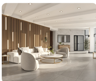
לובי יוקרתי (הדמיה)