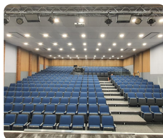
היכל תרבות (ביצוע)