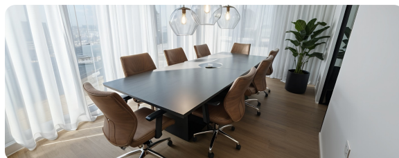
חדר ישיבות (ביצוע)