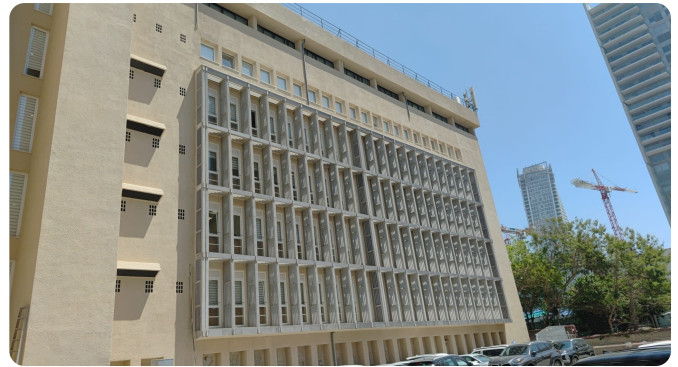
חזיתות לשימור – תוצאה לאחר השיפוץ