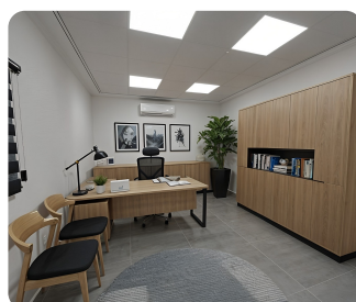
משרד מנהל (ביצוע)