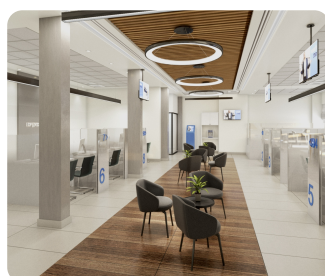
סניף בנק (הדמיה)