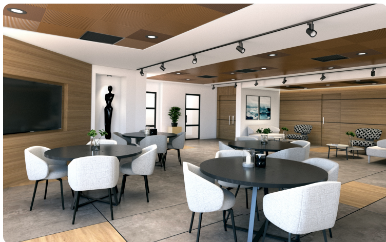
לובי משרד ביהוד (הדמיה)

מבחר מתוך עשרות פרויקטים שביצענו בשנים האחרונות – הדמיות ותצלומי ביצוע.