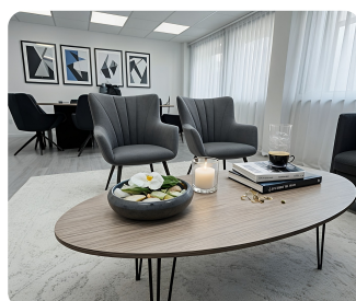
מרחב ישיבה (ביצוע)